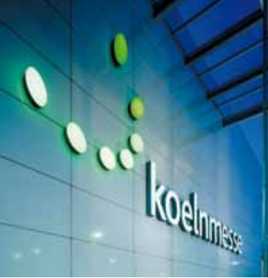
Charakteristisch: das Logo der Koelnmesse mit den sieben grünen Punkten.

von Fluggesellschaften fliegt Köln zu sehr günstigen Konditionen an – allein 100 „Low-Cost-Strecken“ verzeichnet der aktuelle Flugplan. So können Besucher der Internationalen Eisenwarenmesse die Reise nach Köln kostengünstig mit weiteren Geschäftsterminen in anderen europäischen Ländern verbinden. Und je früher die Flüge gebucht werden, desto größer ist oft die Chance auf einen besonders günstigen Tarif. Über den Link „Anreise“ auf der Website www.eisenwarenmesse.de können günstige Konditionen für Flüge mit dem Buchungssystem der Koelnmesse realisiert werden.